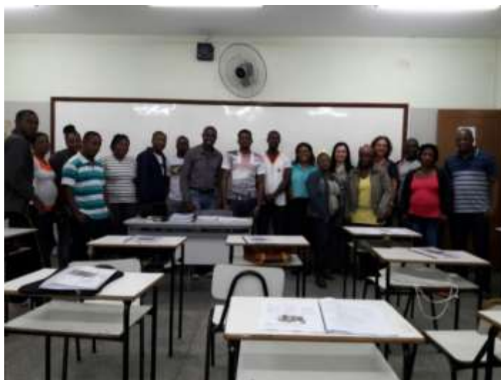
Imagem 1 – Grupo de cursistas haitianos - Escola Estadual Orcírio Thiago de Oliveira.