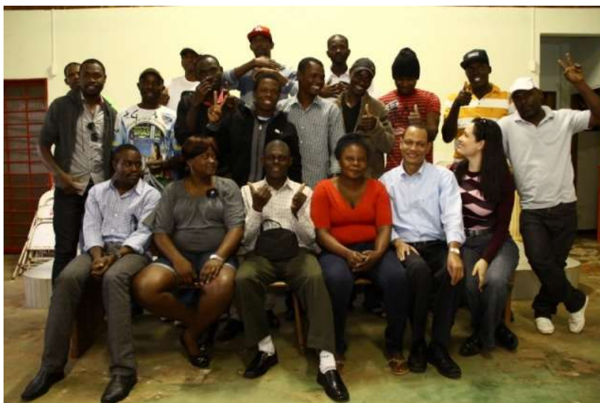
Imagem 2 – Grupo de haitianos que se reúnem no salão da Paróquia Divino Espírito Santo aos sábados.